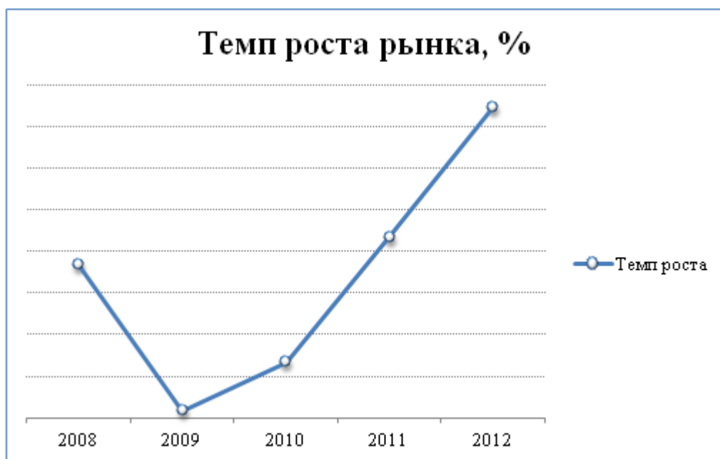
График 2 – Динамика развития российского рынка нефтепродуктов, %

Наблюдается спад в темпах роста рынка в 2009 году на 1,8%. На 2012 год темпы роста рынка опережают темп роста в послекризисный период и составляют ***% в год. В среднем рынок растет на ***% ежегодно.