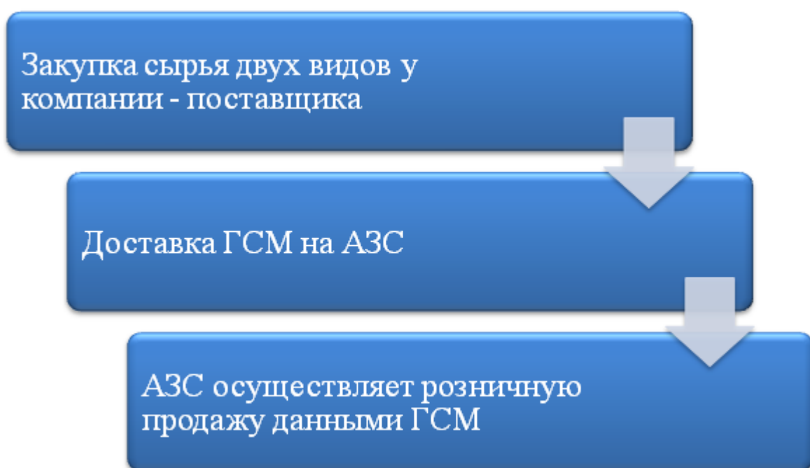
Рисунок 1 – Процесс розничной продажи на АЗС

Процесс торговли на АЗС будет выглядеть следующим образом: