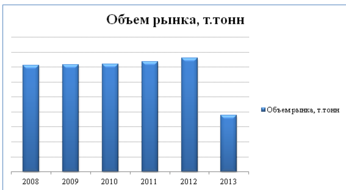
График 1 – Объем российского рынка нефтепродуктов, т.тонн.

Объем и динамика роста рынка нефтепродуктов представлены на рисунках ниже.